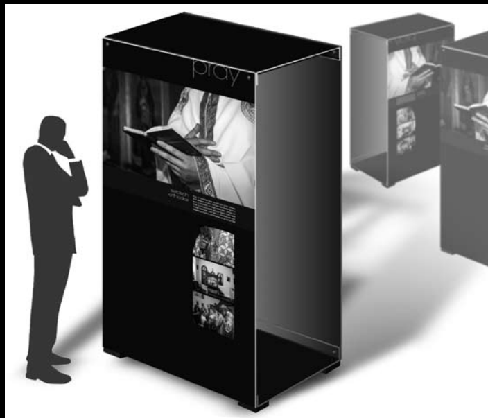
Ausstellungssystem (für 16 Motive) B 1,20 m x H 2,20 m x T 0,50 m

beten · prier · rezar · orare · pregare orar · pregi · að biðjast fyrir · a se ruga dua etmek · moliti se · bidden · à be att be · bider · palvetamah · mádkozik صلى · modlić się · молиться · להתפלל · 祷告