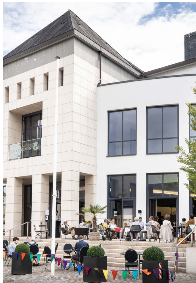
Trifo Apéro