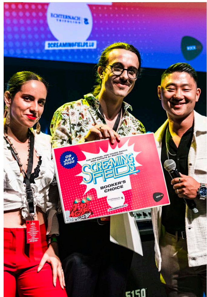
Triana y Luca / Screaming Fields

Rotondes | Animato a.s.b.l. | Kammerata Luxembourg | Kopla Bunz a.s.b.l. | CELL - Transition Hub | CNL | Ciné Sura | Oeuvre Nationale de Secours Grande-Duchesse Charlotte | GERO | Klimapakt | Fond National de la Recherche | D'Ligue - Ligue Luxembourgeoise de Santé Mentale | EME | Mamie et Moi a.s.b.l. | Making Dances a.s.b.l. | United Instruments of Lucilin