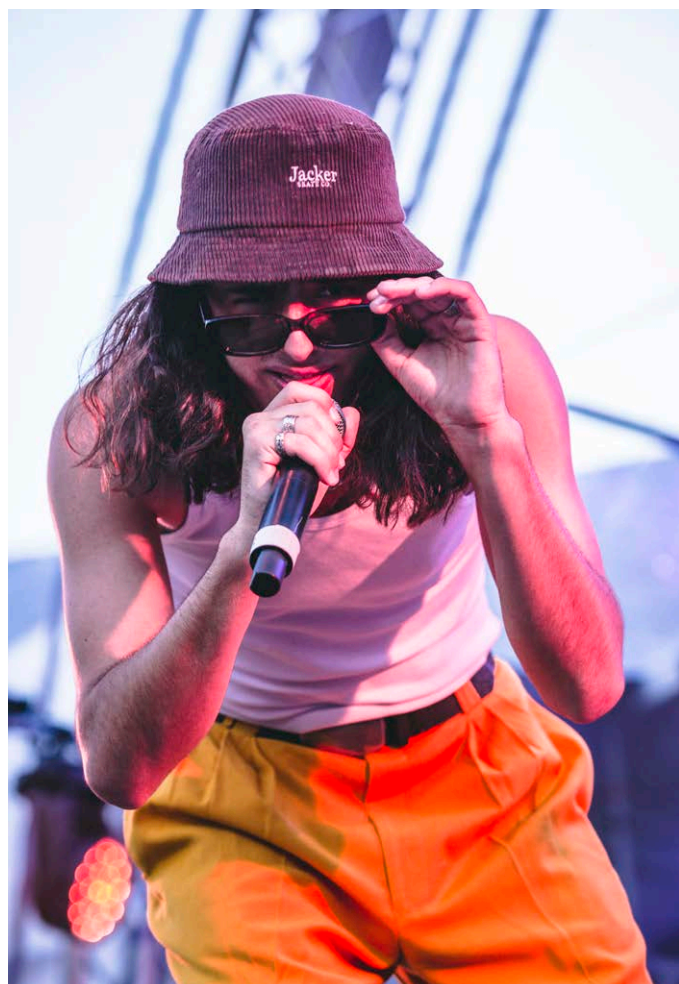
Culture the Kid X Jambal / Max Giesinger

La fin a été marquée par le groupe caractérisé par une pop passionnée Luciel ainsi que Electro Deluxe, un groupe au son unique inspiré des années 70.