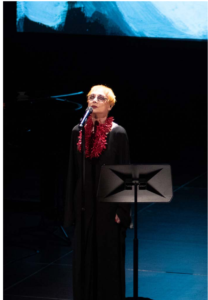
Mísia

Mísia, la « grande dame » du fado portugais, est reconnue par de nombreux connaisseurs comme l'héritière de la légende du fado Amália Rodrigues, décédée en 1999. Après son 14e album Pura Vida [Banda Sonora], avec lequel elle a réussi à franchir les frontières stylistiques, Mísia a présenteré à Echemnach son nouvel album Sentimental Animal, conte d'une vie riche d'épisodes poétiques et émotionnels sur 30 ans de carrière musicale.