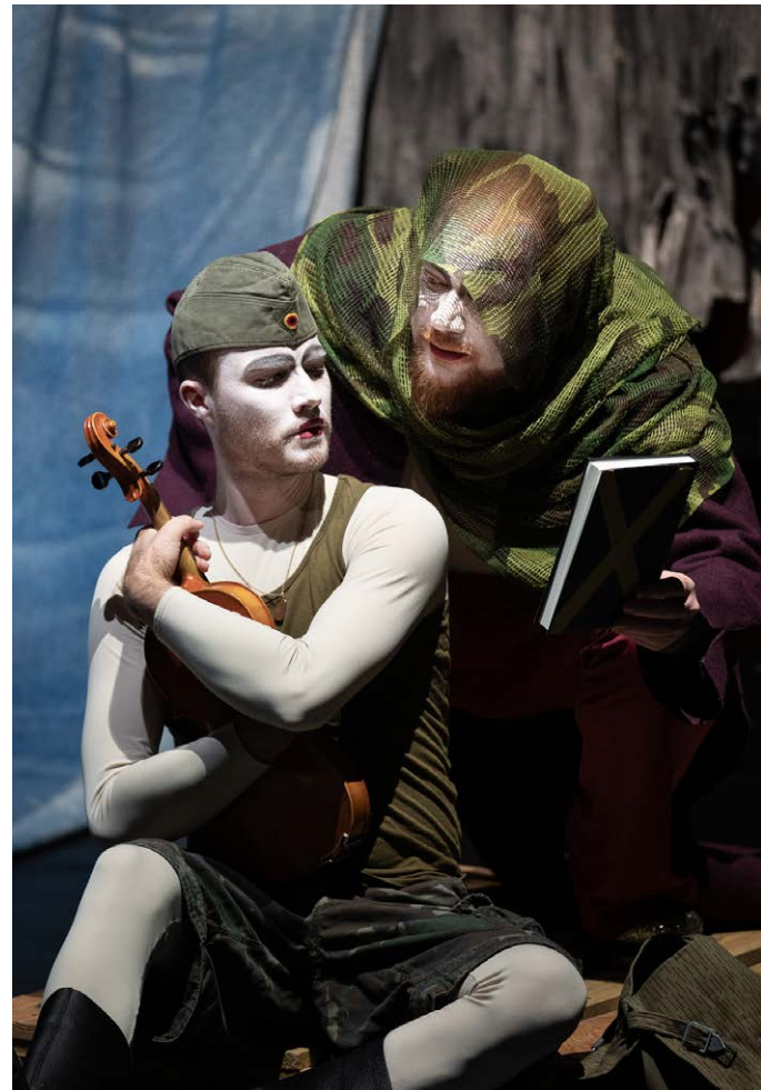
Die Geschichte vom Soldaten © Pierre Weber